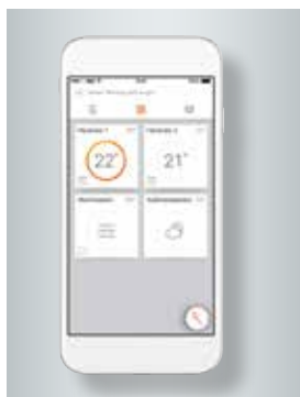
Avec l'application ViCare, tout est sous contrôle – même à distance