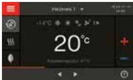
Régulation Vitotronic 200 avec écran tactile couleur

* Conditions et aperçu des produits sur www.viessmann.be