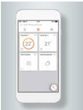
Avec l'application ViCare, tout est sous contrôle – même à distance