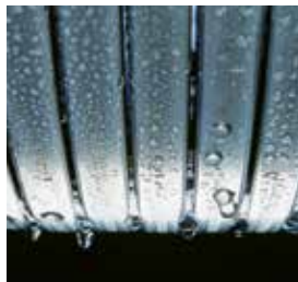
Echangeur de chaleur Inox-radial – durable et efficace