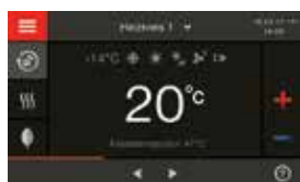
Régulation Vitotronic 200 avec écran tactile couleur

* Conditions et aperçu des produits sur www.viessmann.be