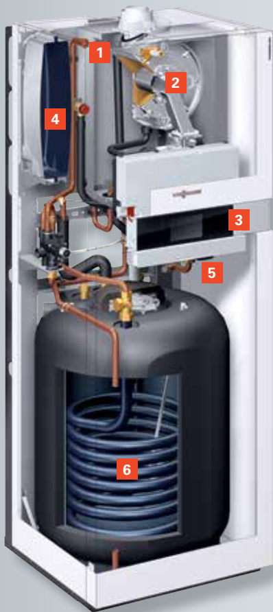
Vitodens 222-F avec réservoir d'eau chaude à serpentin émaillé (type B2SB) pour les régions où l'eau est dure