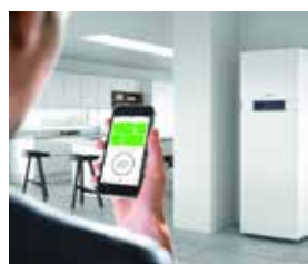
Gestion de l'installation de chauffage par l'application ViCare