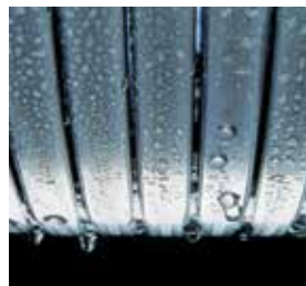
Echangeur de chaleur Inox-radial – durable et efficace