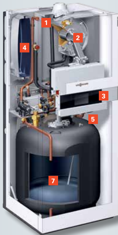
Vitodens 222-F avec réservoir de stockage émaillé (type B2TB)