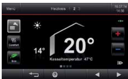
Régulation Vitotronic avec écran tactile couleur