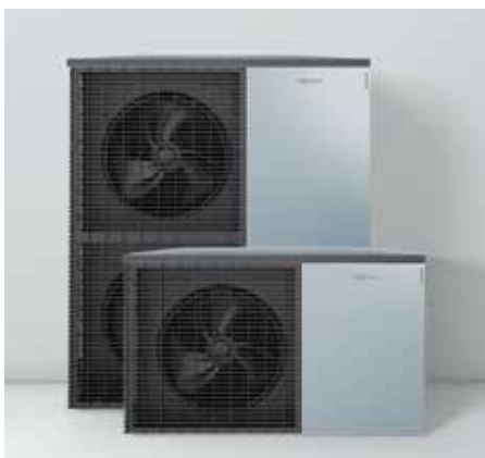
Unités extérieures dans le design Viessmann – Made in Germany