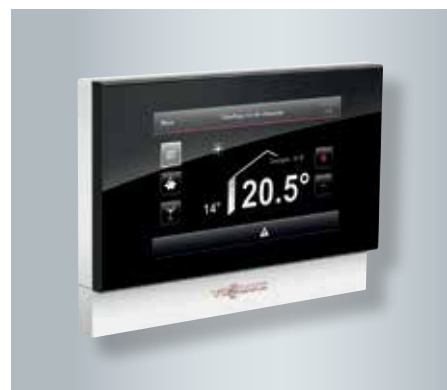
Commande à distance Vitotrol 350 avec écran tactile pour la pièce d'habitation

L'écran tactile Vitotrol 350 permet de commander la chaudière bois à gazéification depuis la pièce d'habitation. Le grand écran 5" au format 16:9 permet d'utiliser la commande très facilement. Il est possible également de remplacer le module de commande intégré dans la chaudière par la version avec écran tactile.