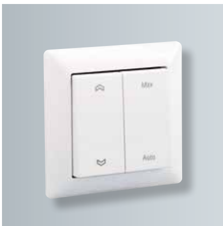
Interrupteur radio esthétique