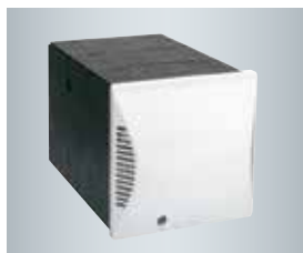
Douille murale carrée avec protection de la paroi extérieure

L'appareil de ventilation compact Vitovent 200-D est conçu pour la ventilation contrôlée de pièces individuelles.