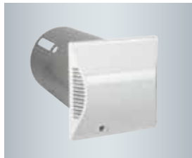
Douille murale ronde avec protection de la paroi extérieure