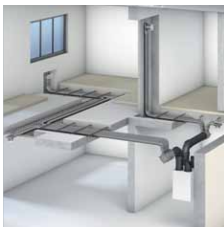
Système de distribution d'air pour le système de ventilation de l'habitation Vitovent 300-W

L'air ambiant humide est une des causes principales de développement des moisissures. Celles-ci peuvent nuire à la santé des habitants et endommager durablement la construction. L'investissement dans un système de ventilation d'habitation est plus avantageux que la réparation des malfaçons dues à la propagation des moisissures.