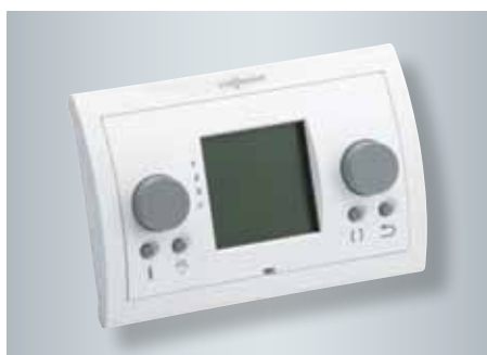
Commande à distance pour Vitovent 300-W

Vitovent 300-W jusqu'à 300 m 3 /h et jusqu'à 400 m 3 /h