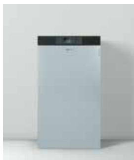
Vitocrossal 100 (CI)