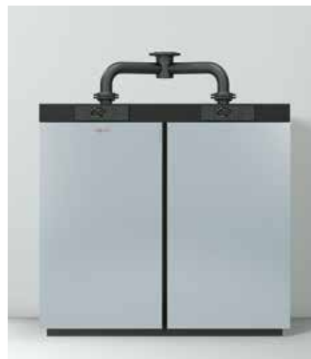
Solution en cascade simple de 240 à 640 kW dans une jaquette

La régulation Vitotronic intégrée permet une mise en service rapide et une simplicité d'utilisation. Le module wifi en option Vitoconnect 100 permet de commander facilement la chaudière au moyen de l'application via Internet. La régulation en cascade Vitotronic 300-K (MW1B) permet de commander jusqu'à huit chaudières.