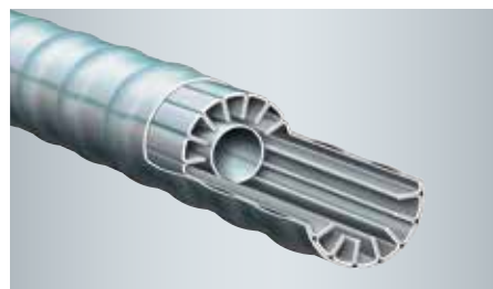
Surfaces d'échange à convection à parois multiples

La régulation Vitotronic avec possibilité de communication et affichage texte et graphique est à la fois pratique et simple d'utilisation. Elle garantit un fonctionnement économique et sûr de l'installation de chauffage complète.