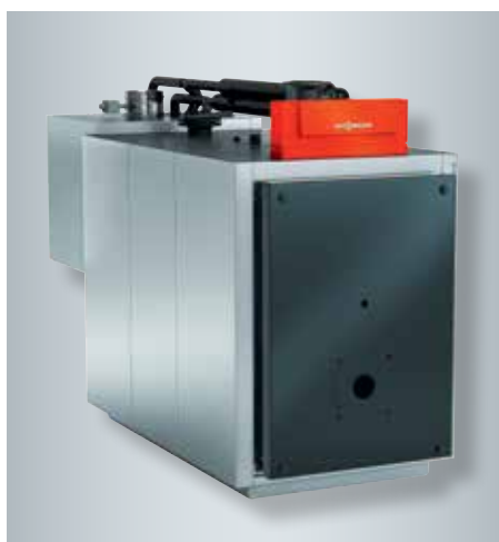
Vitoradial 300-T de 101 à 335 kW