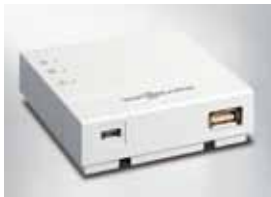
Vitoconnect 100 avec connexions pour le bloc adaptateur réseau (gauche) et la connexion de données

L'application ViCare offre de nouvelles possibilités de réguler le chauffage via Internet. Son interface graphique volontairement simplifiée vous permet de commander votre chauffage de manière entièrement intuitive.