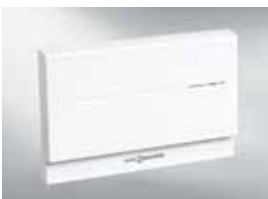
Module de communication Vitocom 100 (type LAN1)

Il est possible p. ex. de présélectionner la température de l'eau via un menu séparé. Les heures de mise en marche et d'arrêt pour la production d'eau chaude et la pompe de circulation peuvent également être réglées.