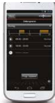
des heures de mise en marche et d'arrêt (illustration pour Android).