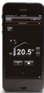
Ecran de démarrage pour la sélection directe de la température ambiante souhaitée (illustration pour iOS).