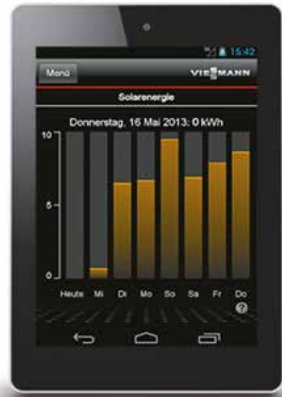
En combinaison avec une installation solaire, le rendement solaire est affiché pour chaque jour (illustration pour la tablette).