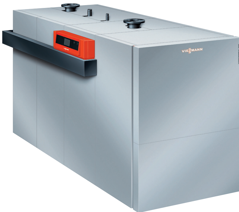
Vitocrossal 200 mit Inox-Crossal-Wärmetauscherfläche und Matrix-Zylinderbrenner, 400 bis 620 kW

Ausgereifte Brennwerttechnik macht den Vitocrossal 200 zum sparsamen Heizkessel für vielfältige Einsatzmöglichkeiten.