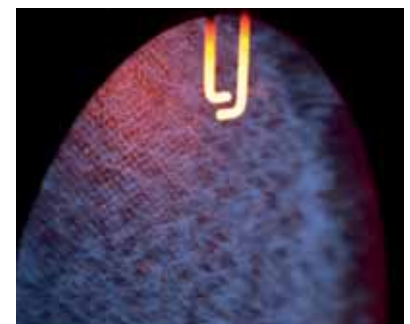
MatriX-Diskbrenner für besonders geräuscharmen und umweltschonenden Betrieb mit einem Modulationsbereich bis 1:6