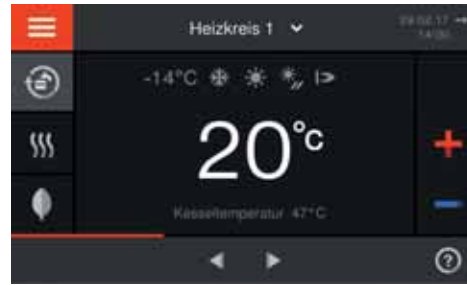
Vitotronic 200 – intuitive Bedienung über großes Farb-Touch-Display

Über Vitocom und Energie-Cockpit lassen sich die Energieverbräuche transparent visualisieren.