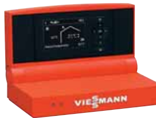
Vitotronic 200 Regelung mit übersichtlicher Menüführung