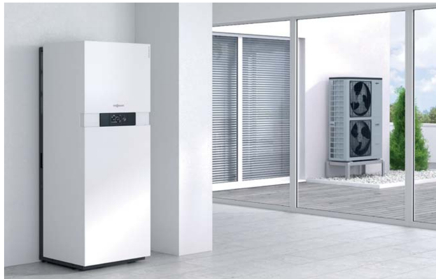
Inneneinheit Vitocaldens 222-F (links) mit silberfarbener Außeneinheit (Typ 222.A29 SL)

Viessmann vereint hocheffiziente Brennwerttechnik mit der Nutzung kostenloser Umweltwärme.