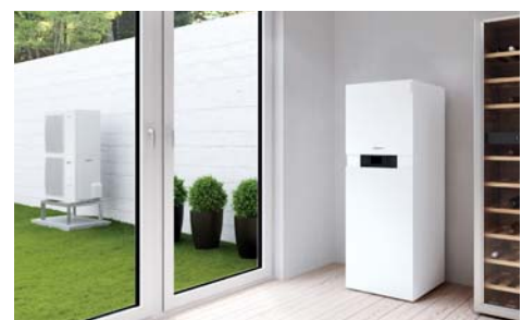
Inneneinheit Vitocaldens 222-F (links) mit weißer Außeneinheit (Typ 222.A29)

Hybrid Pro Control ermittelt diesen Zeitpunkt automatisch und reagiert entsprechend: nach den aktuell eingegebenen Energiekosten für Strom und Gas wird errechnet, welcher Energieträger im Moment am effizientesten eingesetzt werden kann. Hybrid Pro Control hat immer das Gesamtsystem im Blick. Der integrierte Energiemanager ermittelt automatisch die effizienteste Betriebsart (Ökonomie oder Ökologie und Komfort).