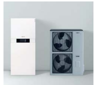
Inneneinheit Vitocaldens 222-F (links) mit Außeneinheit (Vitosilber)