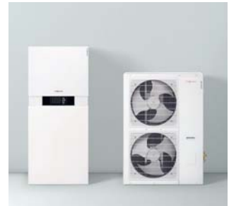
Inneneinheit Vitocaldens 222-F (links) mit Außeneinheiten (Weiß)