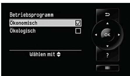
Regelung Vitotronic 200 mit Hybrid Pro Control – Auswahl der Betriebsart „Ökonomie“ oder „Ökologie“