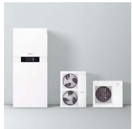
Vitolacaldens 222-F mit Außeneinheiten

Das Hybrid-Kompaktgerät Vitolacaldens 222-F ist bereits für die Nutzung von selbst erzeugtem Strom aus einer Photovoltaik-Anlage vorbereitet. Damit werden bei entsprechend hohem Solarertrag kostensparend die elektrischen Komponenten betrieben.