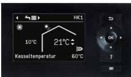
Vitotronic Regelung – leichte Bedienung dank einfacher Navigation und großem, klar ablesbarem Display, zum Beispiel zum Einstellen der Schaltzeiten.